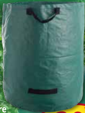
Faltbare Gartentasche mit Tragegriffen ca. 272 Ltr., Tragkraft max. 50 kg