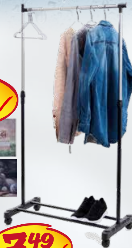
Fahrbarer Kleiderständer mit 1 Stange 76 cm breit, fahrbar und höhenverstellbar