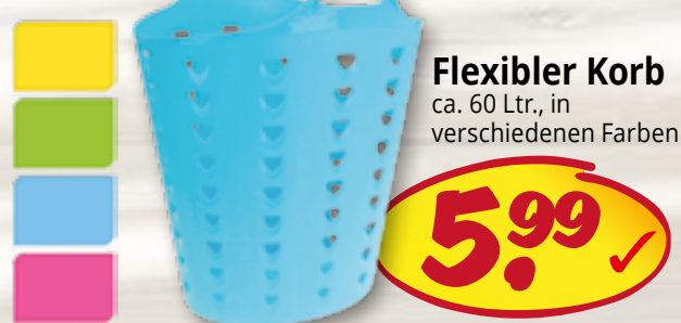
Flexibler Korb ca. 60 Ltr., in verschiedenen Farben