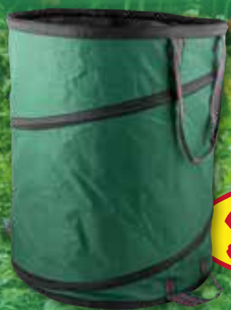
Pop-Up Gartentonne aus besonders reißfestem Gewebe 120 Ltr. H ca. 75 cm, Ø ca. 45 cm