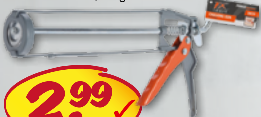
Kartuschenpresse mit Stift zum Öffnen von eingetrockneten Kartuschendüsen, Länge ca. 340 mm