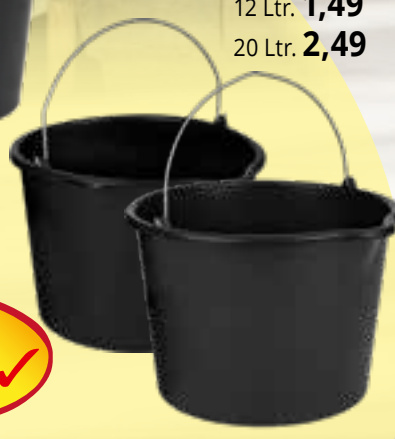
Bau Eimer mit Ausgießer 12 Ltr. 1,49 20 Ltr. 2,49