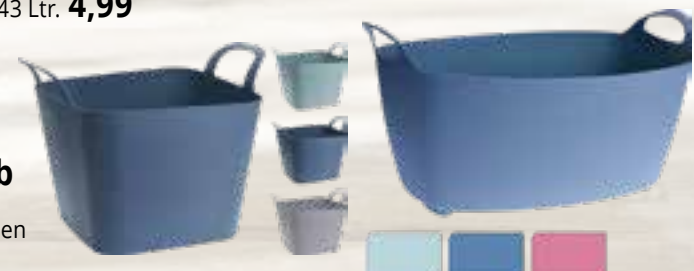
Flexibler Universalkorb in verschiedenen Farben eckig, 60 Ltr., oder oval, 65 Ltr.