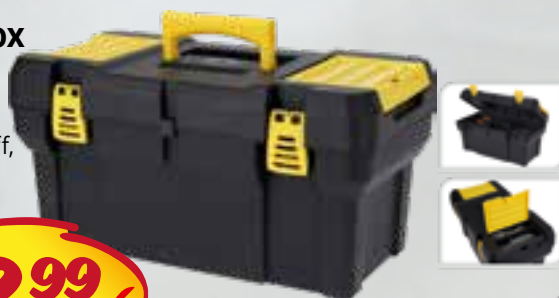
Werkzeugbox Kunststoff, Abmessungen ca. 50x27x27 cm, Innenfach mit Griff, zwei Fächer im oberen Deckel