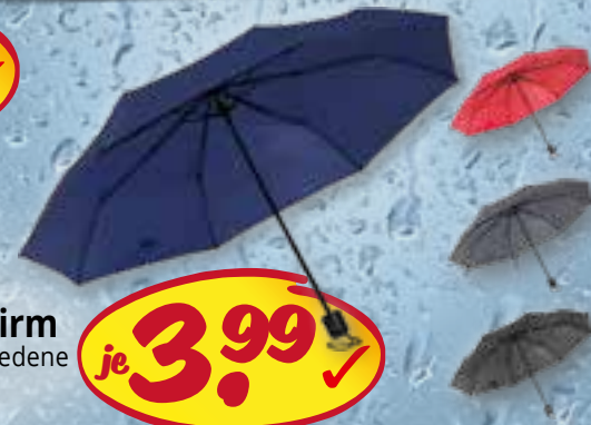
Taschenschirm mit Hülle, verschiedene Farben