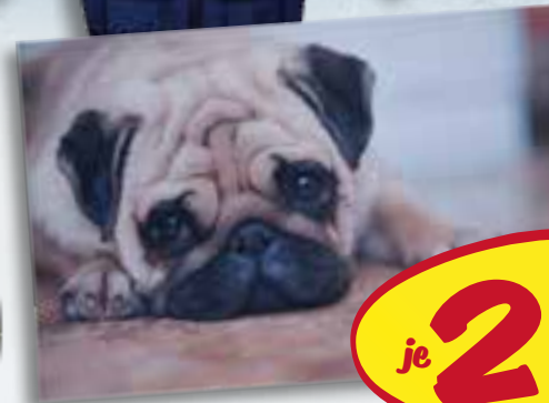
Fußmatte ca. 58x38 cm, 6 verschiedenen Tiermotive