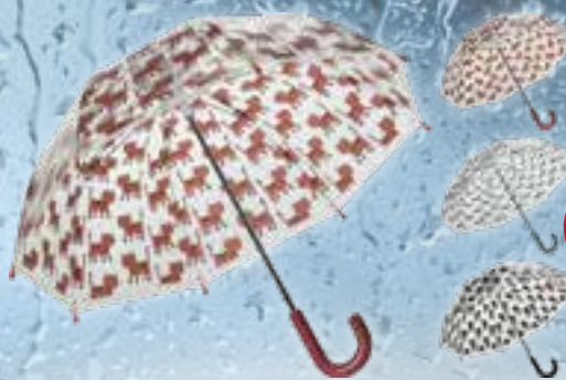
Regenschirm für Kinder transparent, kuppelförmig, mit Metallstiel, leicht zu öffnen und zu schließen, 3 verschiedene Motive