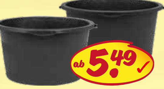
Bau Kübel schwarz Ø 55cm - 65 Ltr. 5,49 Ø 60cm - 90 Ltr. 6,49