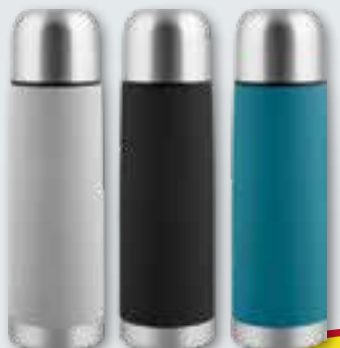
Thermobecher Premium 450 ml, Edelstahl, verschiedene Farben