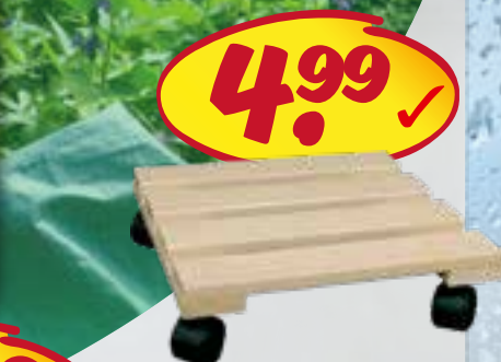
Pflanzenroller ca. 30x30 cm, aus stabilem Buchenholz, mit 4 Rollen, Tragkraft 120 kg