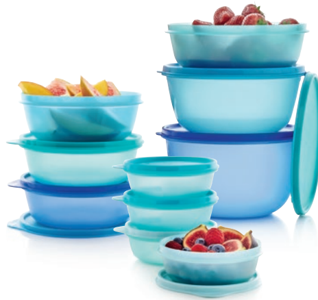
4 Auswahl-Sternegeschenk 700 +a Großes Frische-Set

1 Dankeschön Party-Geschenk 250 a Ab € 250 Partyumsatz erhältst du im Oktober den neuen Bamboo Clear Storage 1,1 l als Geschenk. 2 Party-Angebot 350 a Ab € 350 Partyumsatz bekommst du 50 % Rabatt auf dein Wunschprodukt aus dem Katalog. 3 Party-Geschenk 450 +a Ab € 450 Partyumsatz + 1 neu vereinbarte Party b bekommst du unser neues Bamboo Clear Storage-Duo . Bestehend aus Bamboo Clear Storage 550 ml und Bamboo Clear Storage 1,9 l. 4 Auswahl-Sternegeschenk 700 +a Ab € 700 Partyumsatz + 1 neu vereinbarte Party b kannst du deine Sterne (60) für das tolle Große Frische-Set einlösen. Bestehend aus Kleiner Hit-Parade (4), Großer Hit-Parade (3), Clarissa ® -Set (3). Alternative Gastgeber/-innen-Programme und weitere Geschenk-Optionen erfährst du von deinem/deiner Tupperware ® Berater/-in oder auf www.tupperware.de