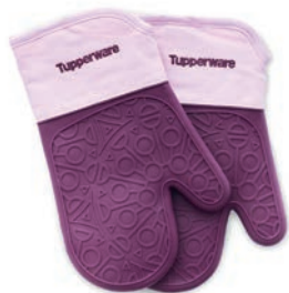
3 Party-Geschenk 450 + Silikon Ofenhandschuhe