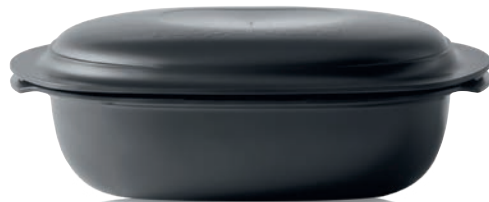
4 Auswahl-Sternegeschenk 675 + UltraPro 2,0-l-Kasserolle

1 Dankeschön Party-Geschenk 225 a Ab 225 € Partyumsatz erhältst du im Oktober unsere Silikon Backunterlage als Geschenk. 2 Party-Angebot 350 a Ab 350 € Partyumsatz bekommst du 50 % Rabatt auf dein Wunschprodukt aus dem Katalog. 3 Party-Geschenk 450 + Ab 450 € Partyumsatz + 1 neu vereinbarte Party b bekommst du die Silikon Ofenhandschuhe . Maße: L 30,6 x B 18,5 cm. 4 Auswahl-Sternegeschenk 675 + Ab 675 € Partyumsatz + 1 neu vereinbarte Party b kannst du deine Sterne (50) für die UltraPro 2,0-l-Kasserolle einlösen. Alternative Gastgeber/-innen-Programme und weitere Geschenk-Optionen erfährst du von deinem PartyManager oder auf www.tupperware.de