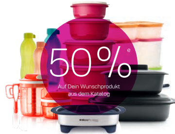
2 Party-Angebot 350 a Dein Wunschprodukt